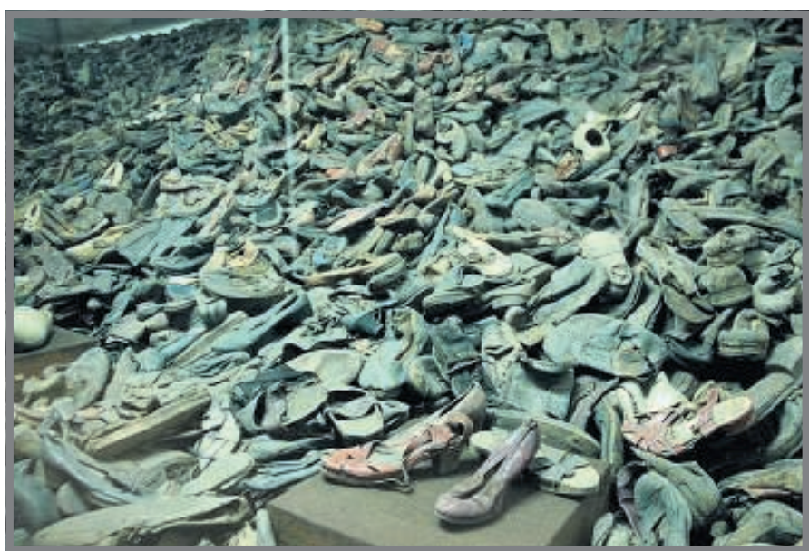
Schoenen van Joodse slachtoffers.

De loodzware rondgang door de complexen van Auschwitz en Birkenau duurt ongeveer vier uur, maar die ervaring zal de bezoeker zijn leven lang niet meer loslaten.