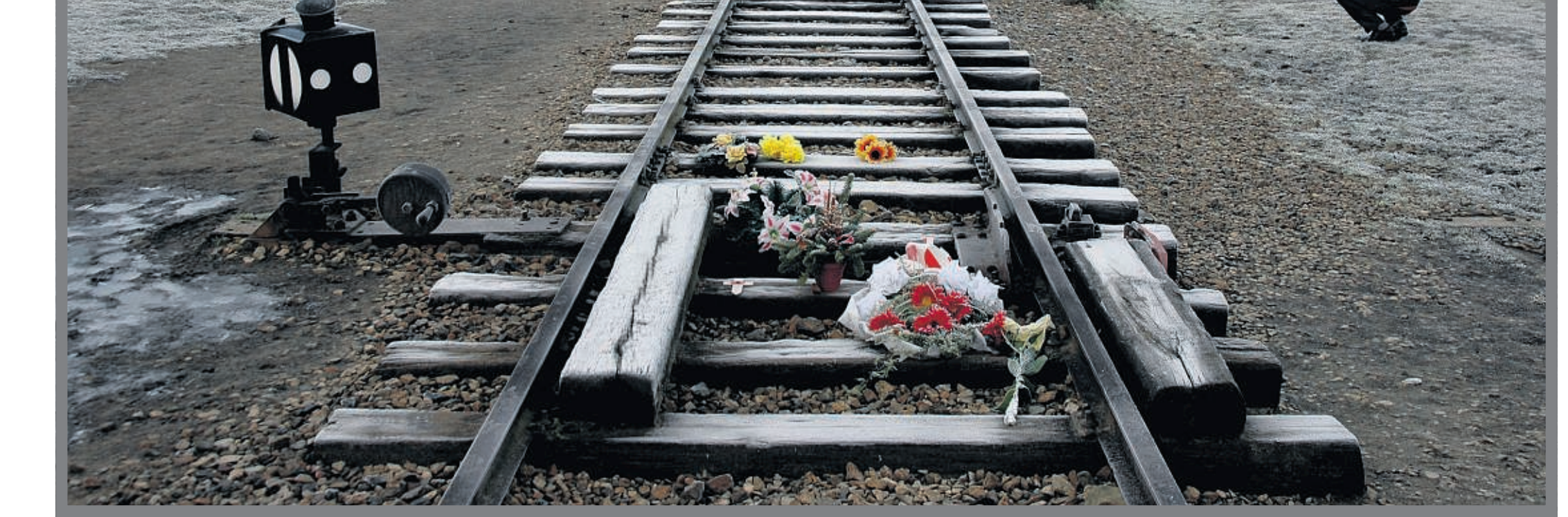
Geen weg terug.

Auschwitz bestaat uit twee delen. Het oude complex met bakstenen gebouwen, Auschwitz I, is in de jaren twintig van de vorige eeuw als een kazerne gebouwd. Het enkele kilometers verderop gelegen niuwere kamp met vooral houten barakken, Auschwitz II of Birkenau, verrees in